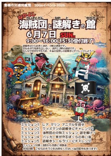
※私たちは持続可能な開発目標(SDGs)を支援しています